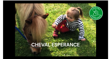
Découvrez notre campagne de dons !