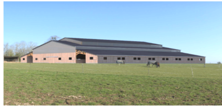
Notre projet avance !